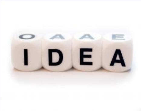
Por una Cámara Ciudadana donde podamos opinar, debatir, aprender y aportar: Día 235.