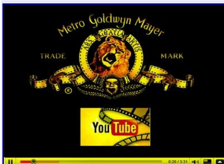
Ahora vea películas completas en YouTube