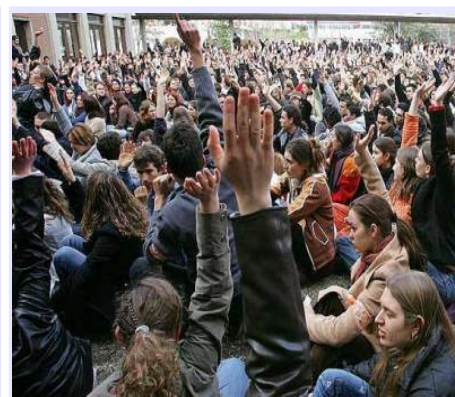
Exijamos plebiscitos nacionales y comunales. ¡ Exijamos democracia!