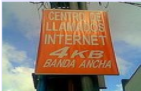
El costo de la conectividad y la banda ancha