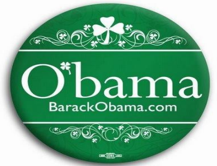
El nuevo discurso ambiental de EE.UU.