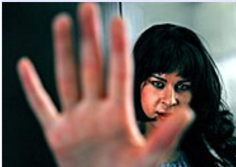
Chile: Detectan nuevos casos de contagiados con sida sin notificar