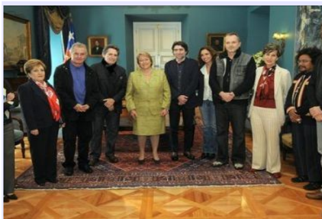
Allende intentó una revolución "exquisitamente democrática", según españoles