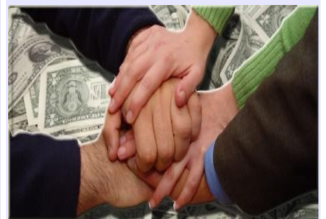
600.000 Euros para la democracia y los DD.HH. en Chile