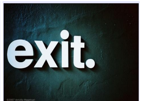
Estudiantes becados regresan a Chile por deficiencia en inglés