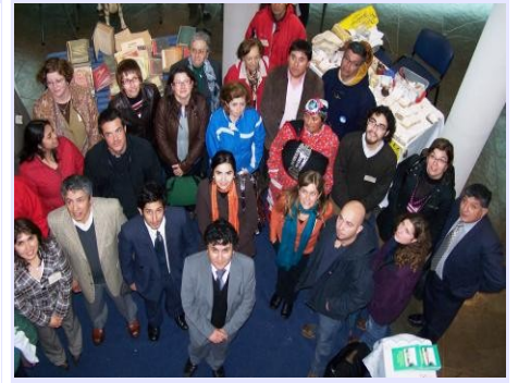
Con importante participación ciudadana