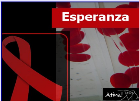
Células que matan el VIH