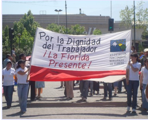
El que no trabaja no recibe sueldo