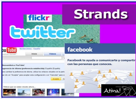
Todo en un solo lugar