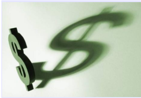
La Plata de los chilenos la malgasta el Estado