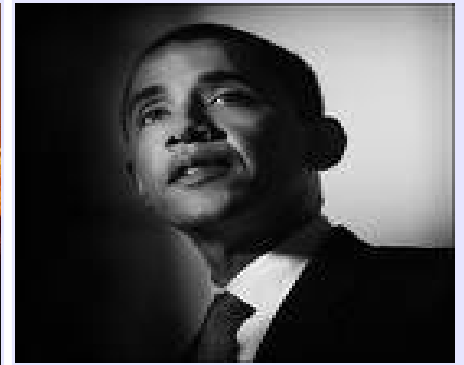
Obama: un caso de asesinato anunciado