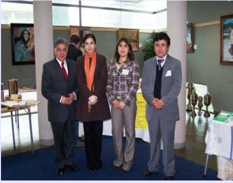
Alcalde Traiguén premiado por el patrimonio