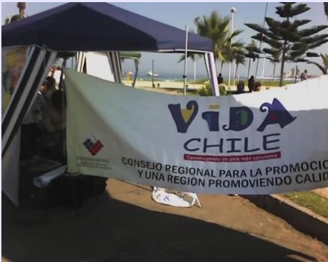
Evento Saludable Masivo, Esforzándose por la Intersectorialidad