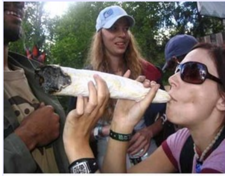
El Dealer como Héroe