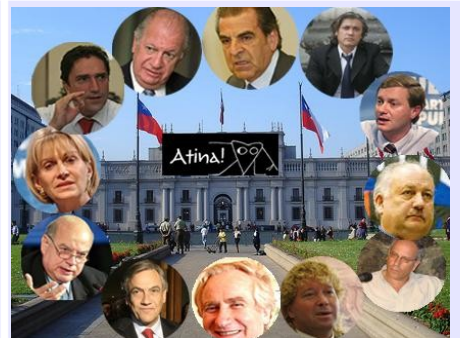
Si las elecciones presidenciales fuesen hoy ¿Por quién votaría?