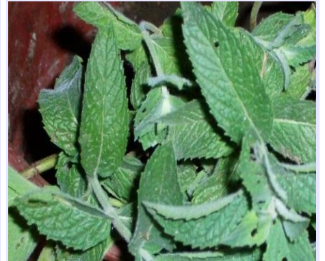
Relación entre la menta y la mente.