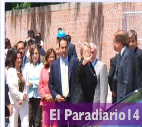
La presidenta Bachelet inauguró Estadio Municipal de La Florida