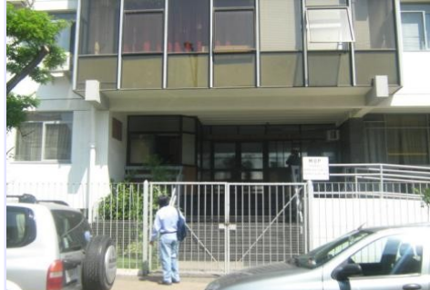
Posible Fraude al Fisco se estima en Cinco Mil millones