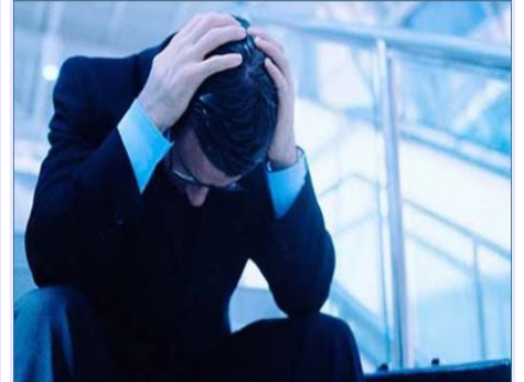
Enfermedad Física... la podemos detener mucho antes!