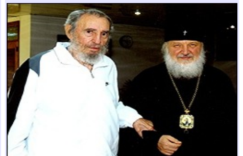
Castro reaparece en foto