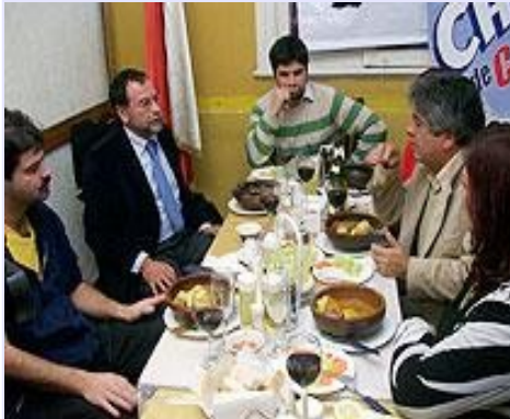
El PRSD también tiene Candidato Presidencial