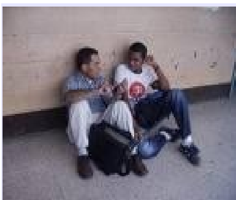
Las Cuatro Leyes Espirituales