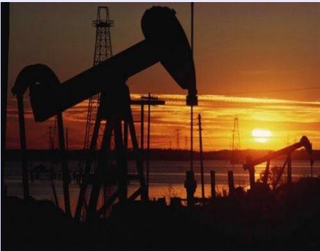
Petróleo barato y en declive