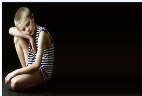
Los profesores y el Síndrome de Asperger