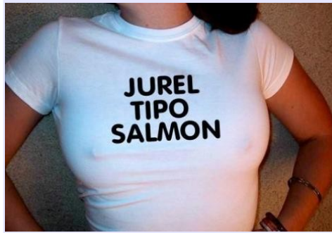
"El día de la Chilenidad" (Jurelísticamente hablando)