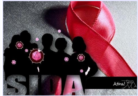
Coordinador de Vivo Positivo: ¿No nos imaginamos nunca esta magnitud?