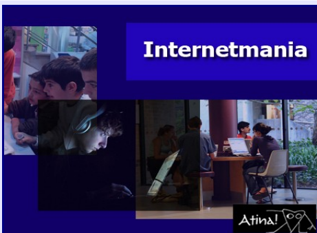
Cuando la red te consume