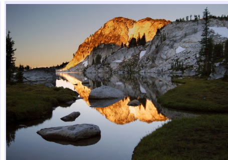
LA SERPIENTE II