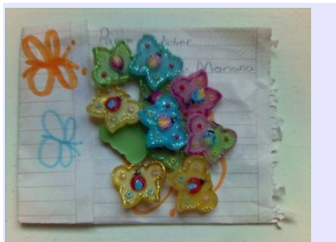
Pequeñas sorpresas, grandes regalos