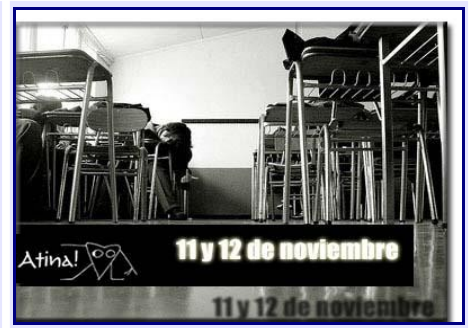
Los profesores llaman a paro