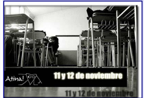
Los profesores llaman a paro