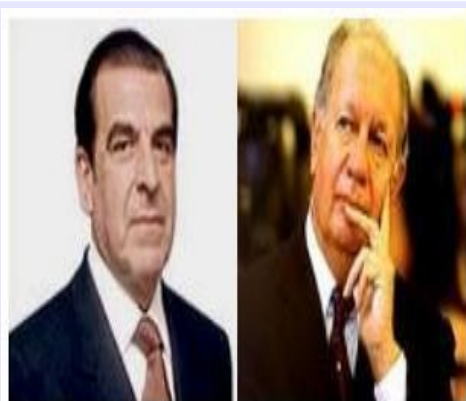
Frei V/S Lagos