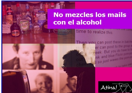
¿Cómo evitar esos correos equivocados?