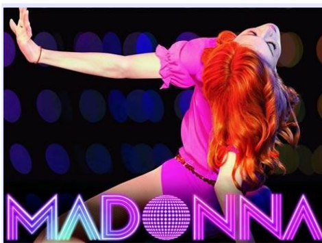
Los dichos de Madonna