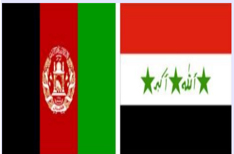
Afganistán e Irak ¿Un infierno para occidente?