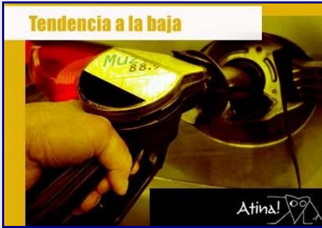
Combustibles y buenas noticias: Bencinas bajarían $54 y diésel $44 el próximo jueves